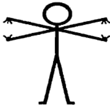
S.O.S. valguse või häälega